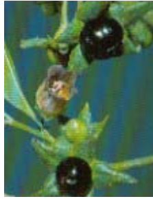
Abb. Beeren der Tollkirsche